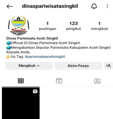
Gambar 1.2 Akun Media Sosial Dinas Pariwisata Singkil

Hingga saat ini, destinasi wisata Pulau Banyak masih bergantung terhadap akun-akun sosial media baik dari sosial media cafe, toko, maupun yang berada di kawasan tersebut hingga sosial media pihak eksternal seperti pengunjung maupun influencer.