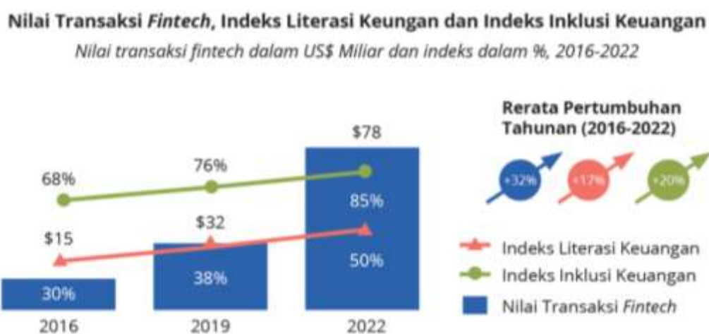
Gambar 1. 2 Transaksi Fintech , Indeks Literasi Keuangan dan Inklusi Keuangan

penting dalam peningkatan inklusi keuangan, karena layanan ini dapat menjangkau kelompok masyarakat yang sebelumnya belum tersentuh oleh lembaga keuangan formal. Namun demikian, penggunaan yang masif ini perlu diimbangi dengan peningkatan literasi keuangan, agar masyarakat tidak hanya menjadi pengguna aktif, tetapi juga mampu memahami dan mengelola keuangan digital secara bijak dan bertanggung jawab. Berikut perkembangan antara jumlah transaksi digital, literasi keuangan, dan inklusi keuangan