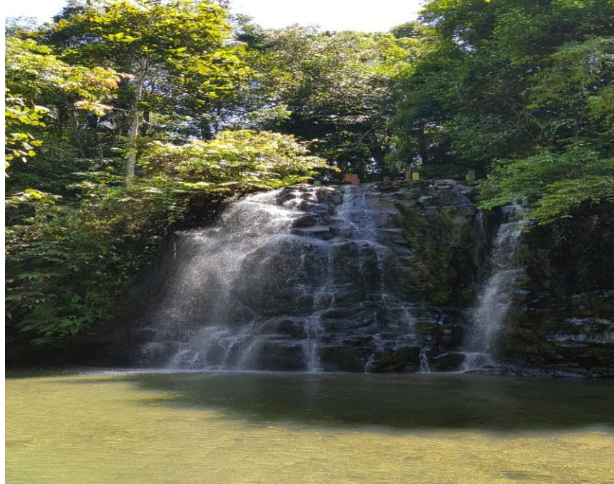
Gambar 1: Objek wisata Air Terjun SKPC