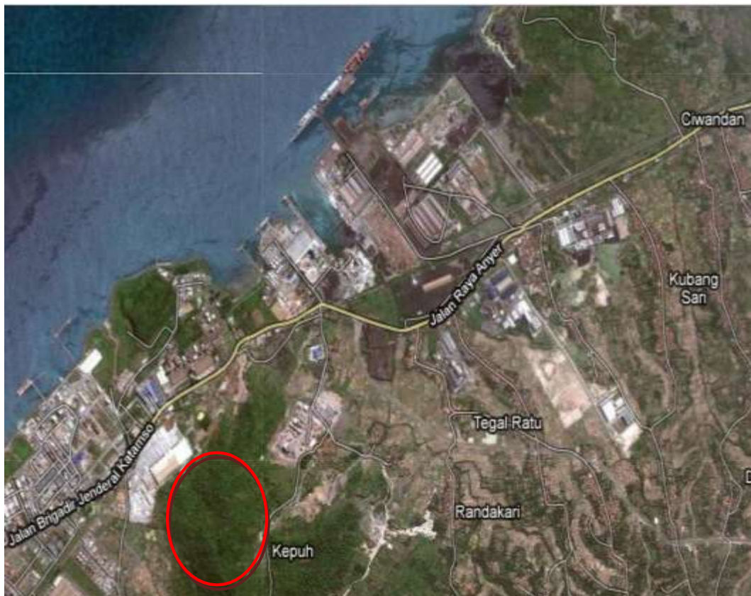
Gambar 1.3 Peta Lokasi Pabrik Metilen Klorida

Berdasarkan pertimbangan diatas Lokasi pabrik didirikan di Kecamatan Cilegon, Kabupaten Serang, Provinsi Banten. Peta lokasi pabrik ditunjukkan pada Gambar 1.3.